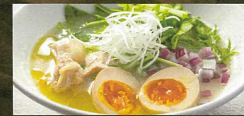
黒胡椒とまろやか黒酢の酸辣湯麵 Hot and Sour Soup Noodles with black pepper and mild black vinegar 黑椒醇和黑醋酸辣汤面 ¥968taxin