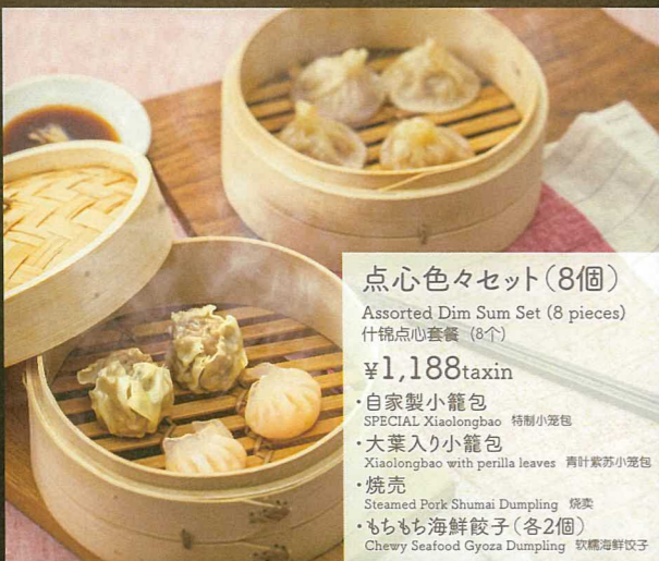
点心色々セット(8個) Assorted Dim Sum Set (8 pieces) 什锦点心套餐(8个) ¥1,188taxin ・自家製小籠包 SPECIAL Xiaolongbao 特制小笼包 ・大葉入り小籠包 Xiaolongbao with perilla leaves 青叶紫苏小笼包 ・焼売 Steamed Pork Shumai Dumpling 烧卖 ・もちもち海鮮餃子(各2個) Chewy Seafood Gyoza Dumpling 软糯海鲜饺子