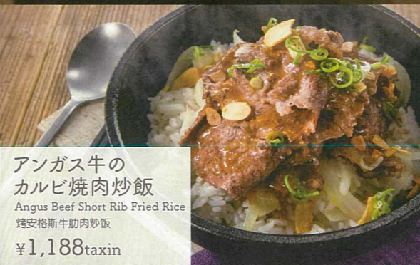
アンガス牛のカルビ焼肉炒飯 Angus Beef Short Rib Fried Rice 烤安格斯牛肋肉炒饭 ¥1,188taxin