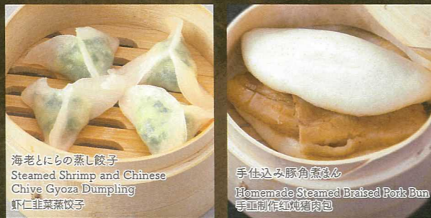
海老とにらの蒸し餃子 Steamed Shrimp and Chinese Chive Gyoza Dumpling 虾仁韭菜蒸饺子