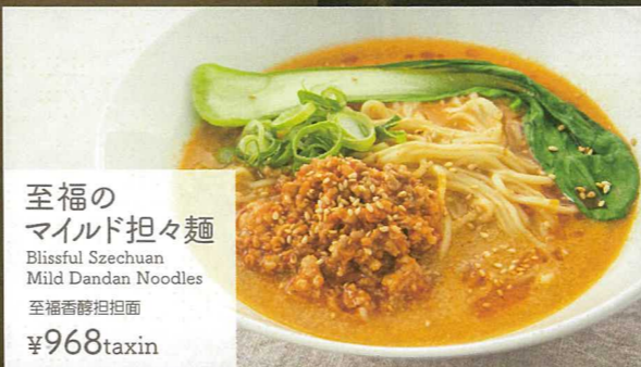
至福のマイルド担々麵 Blissful Szechuan Mild Dandan Noodles 至福香醇担担面 ¥968taxin