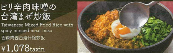
ピリ辛肉味噌の台湾まぜ炒飯 Taiwanese Mixed Fried Rice with spicy minced meat miso 香辣肉酱台湾什锦炒饭 ¥1,078taxin