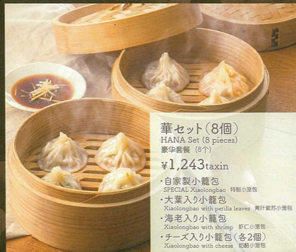
華セット(8個) HANA Set (8 pieces) 豪华套餐(8个) ¥1,243taxin ・自家製小籠包 SPECIAL Xiaolongbao 特制小笼包 ・大葉入り小籠包 Xiaolongbao with perilla leaves 青叶紫苏小笼包 ・海老入り小籠包 Xiaolongbao with shrimp 虾仁小笼包 ・チーズ入り小籠包(各2個) Xiaolongbao with cheese 奶酪小笼包