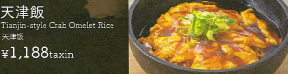
天津飯 Tianjin-style Crab Omelet Rice 天津饭 ¥1,188taxin