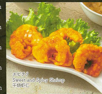
エビチリ Sweet and Spicy Shrimp 干烧虾仁