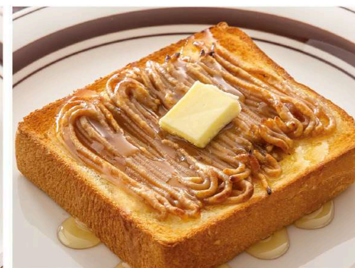
マロンハニーバタートースト 620円