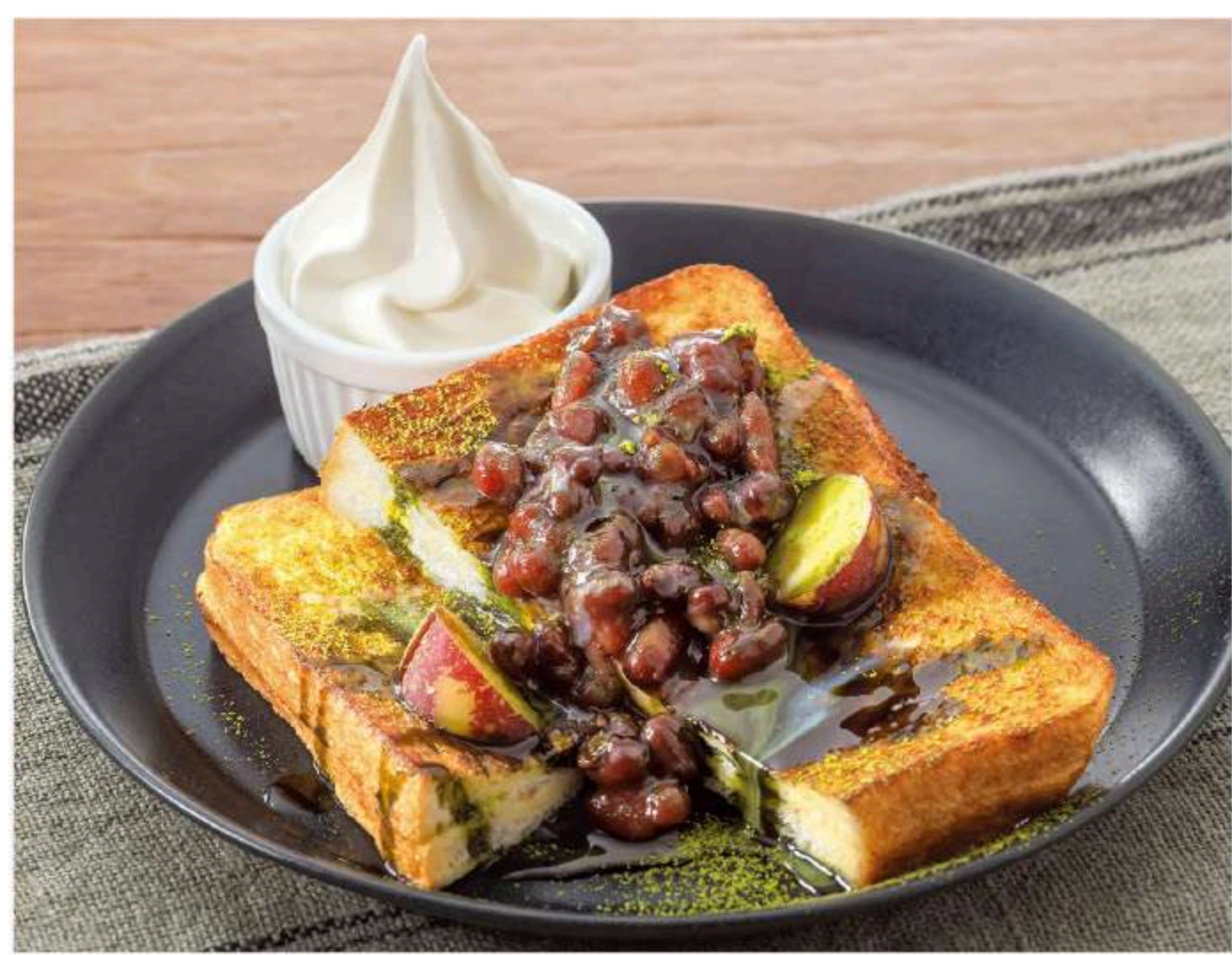
抹茶ミルクフレンチトースト 880円

定番 メープルフレンチトースト 820円 ふわりとろトーストを香ばしく焼き上げた王道フレンチトースト。メープルの甘さがお口に広がります。