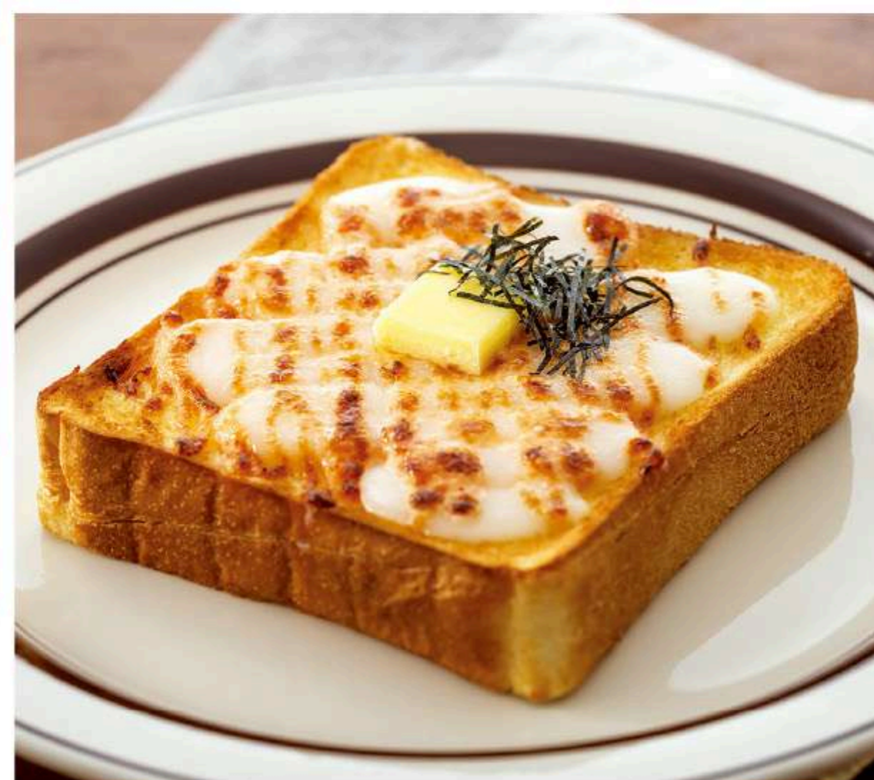
餅明太マヨバタートースト 640円