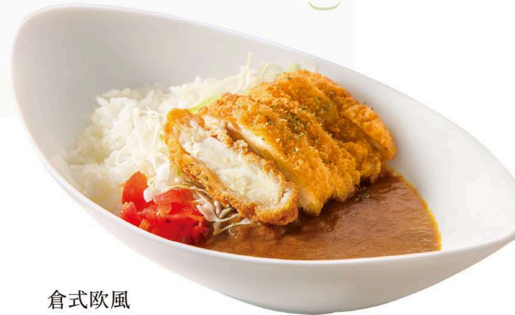
倉式欧風 チキンカツカレー 1,070円