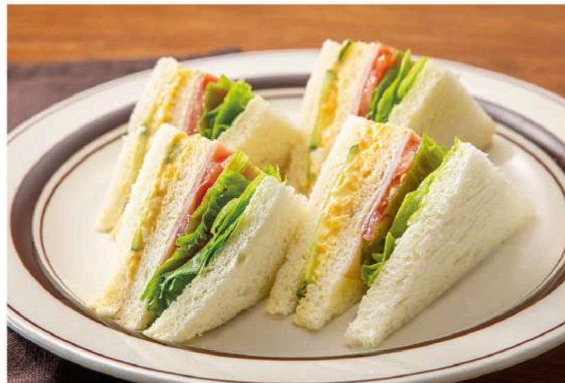
ミックスサンド 680円