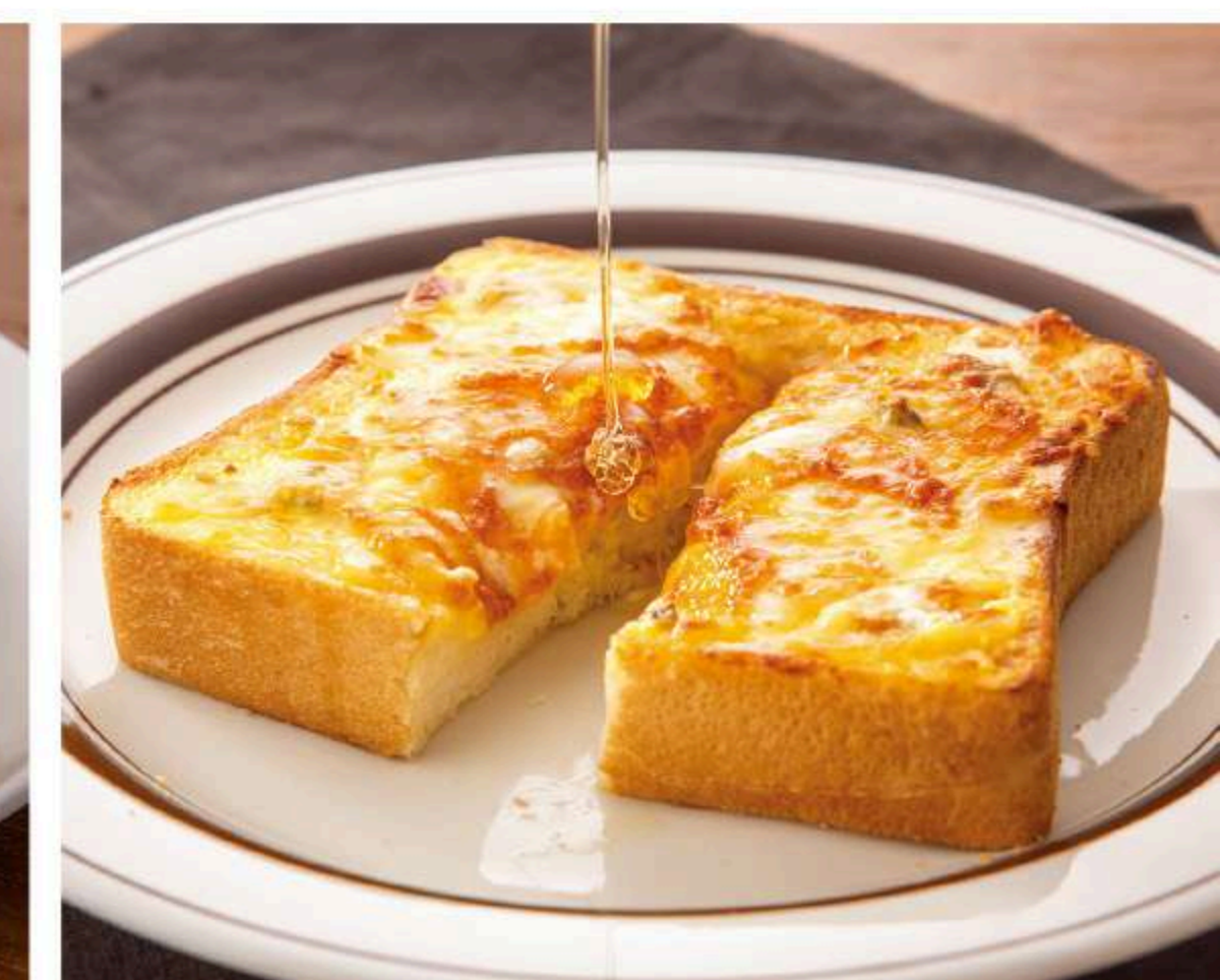
ハニーチーズトースト 630円