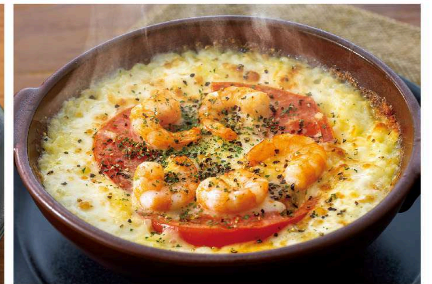
海老とトマトのクリームドリア 960円