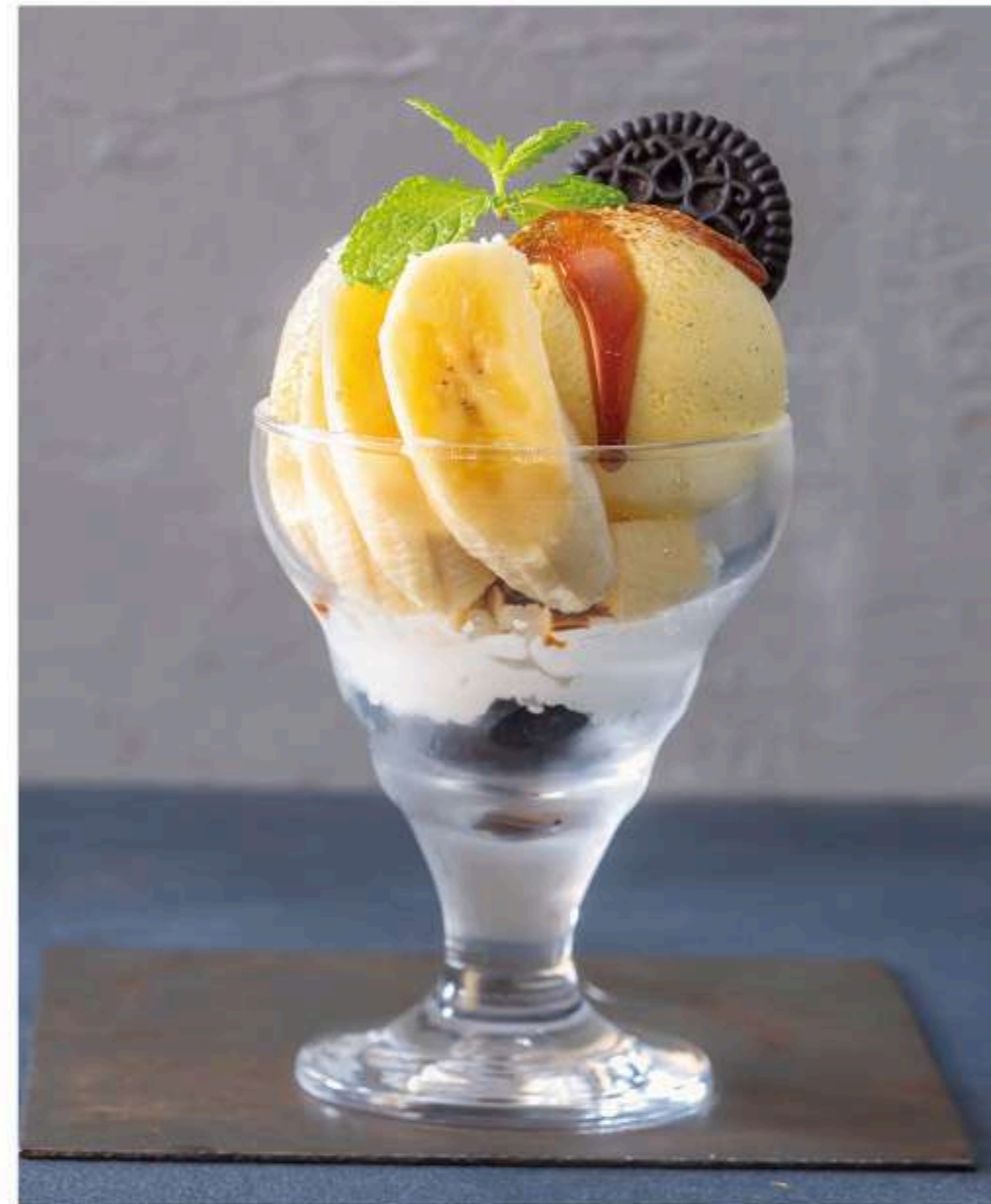
キャラメル バナナパフェ 750円