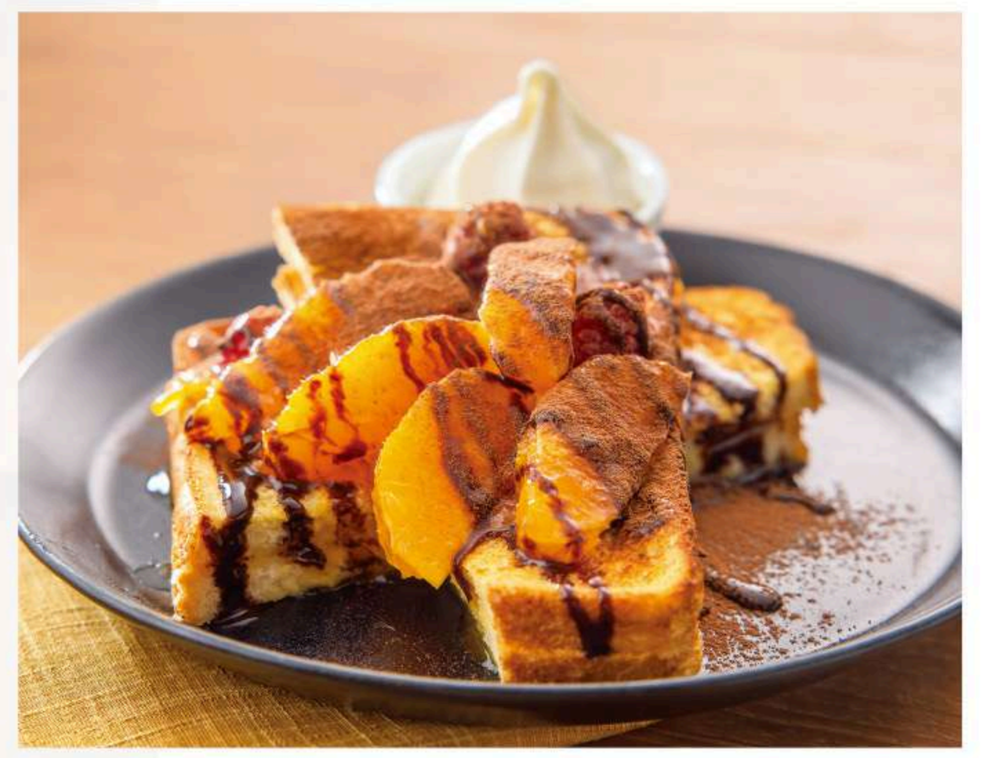
チョコオレンジフレンチトースト 880円