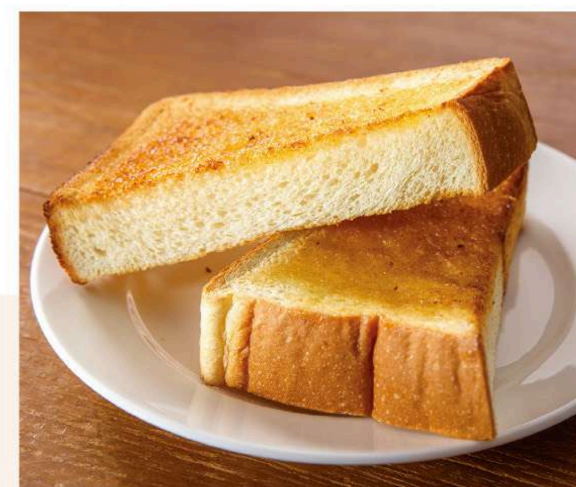
厚切りトースト 260円