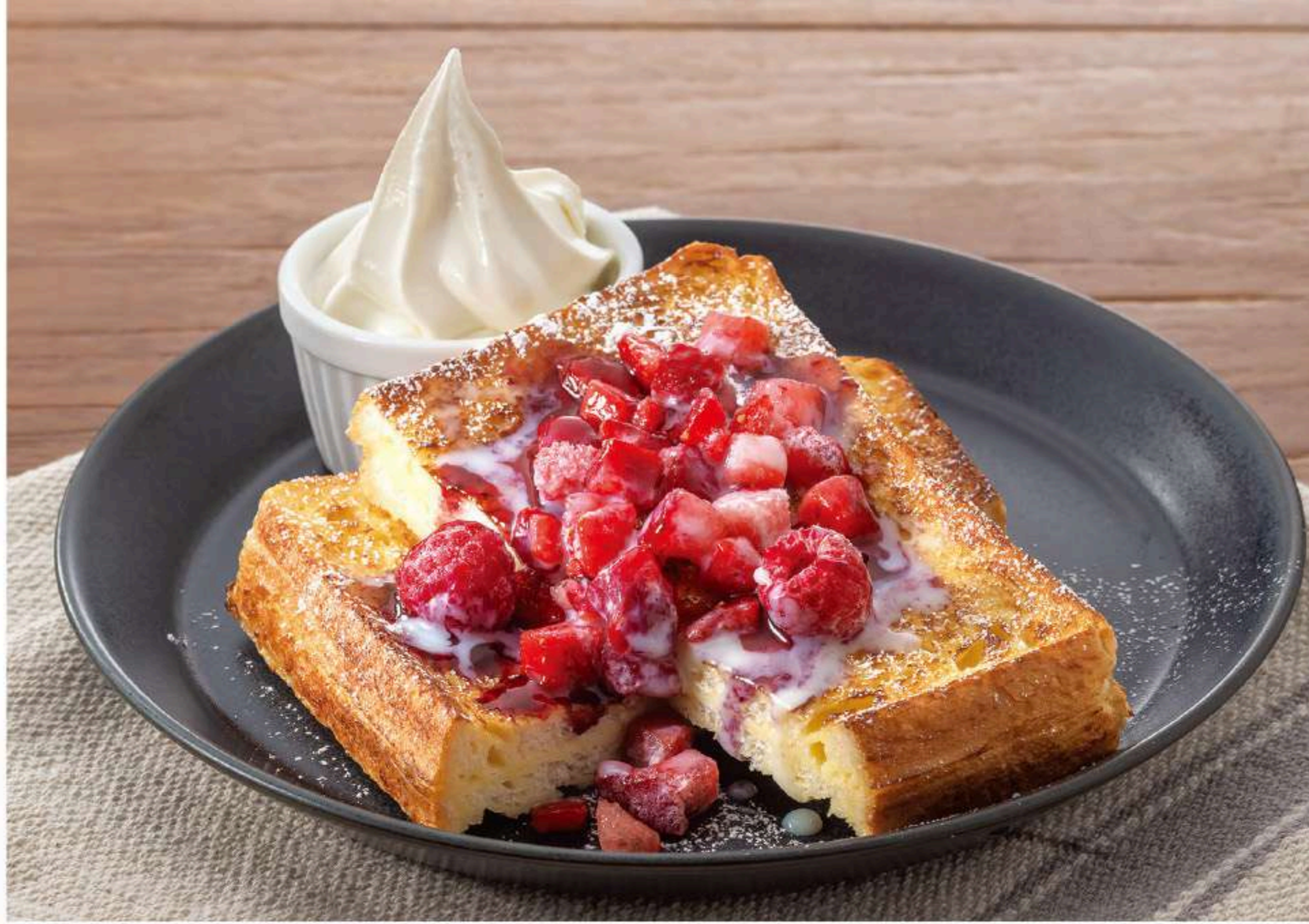
ベリーフレンチトースト 880円