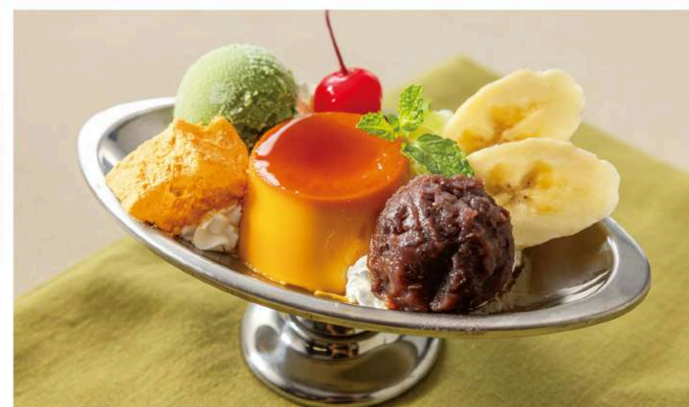
倉シック「和」プリンアラモード 880円