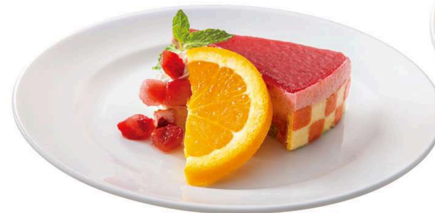
あまおうムース 750円