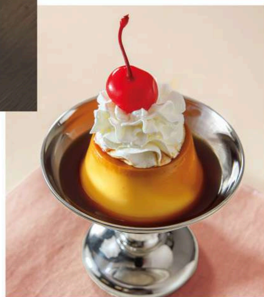
倉シックプリン 580円