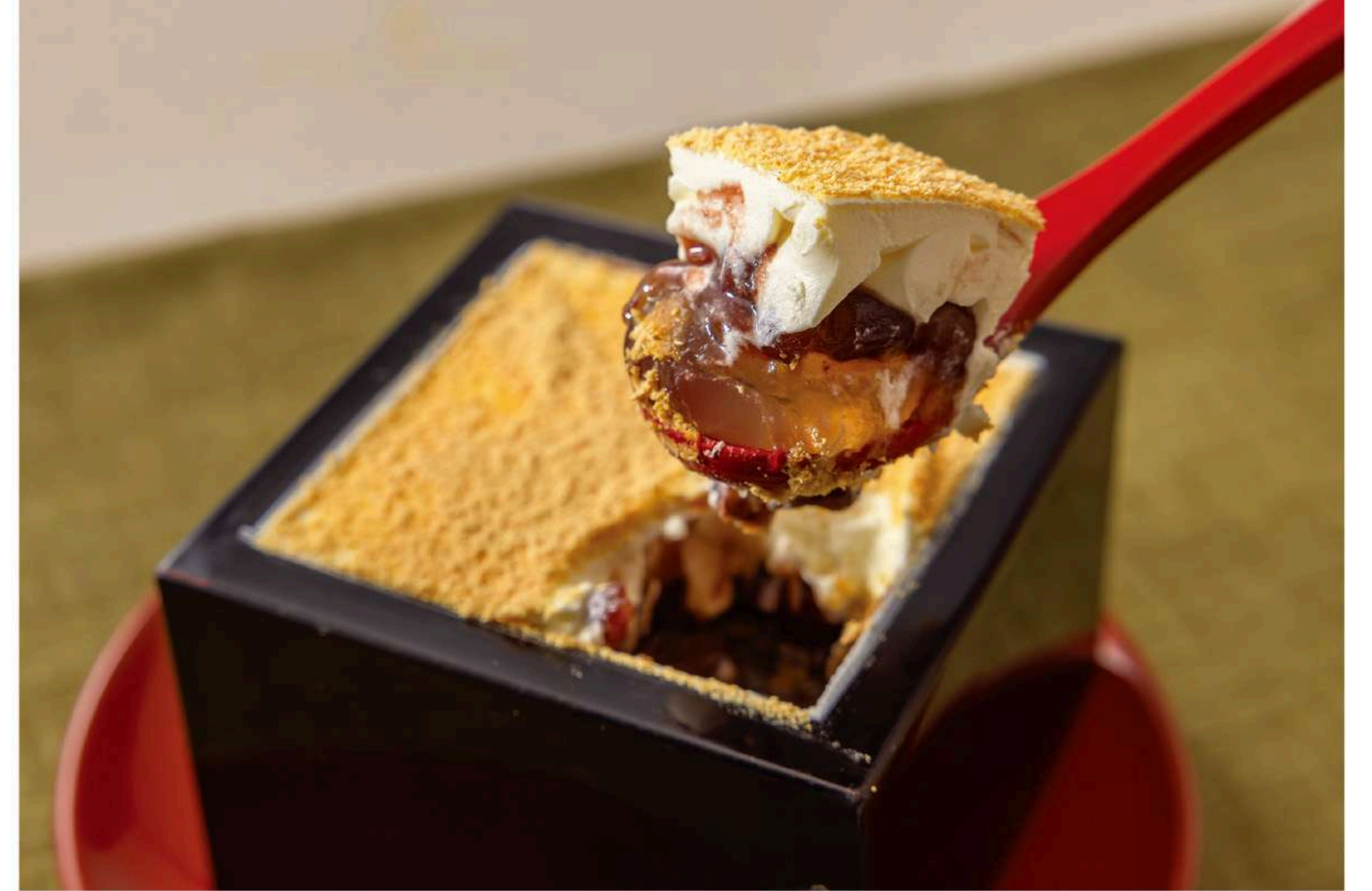
枳わらび餅 630円 柔らかかわらび餅とゆであずきをマスカルポーネで仕上げました。