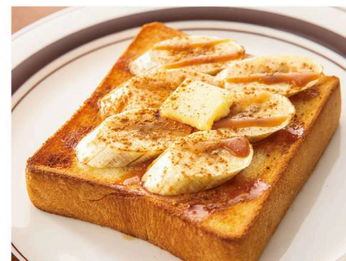
シナモンバナナバタートースト 620円