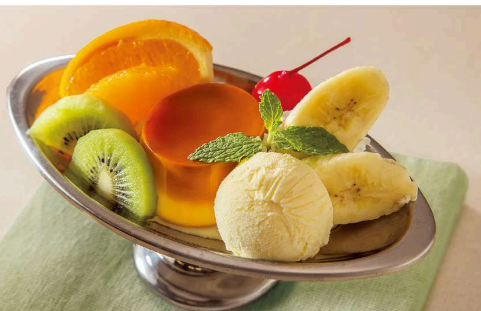
倉シックプリンアラモード 880円