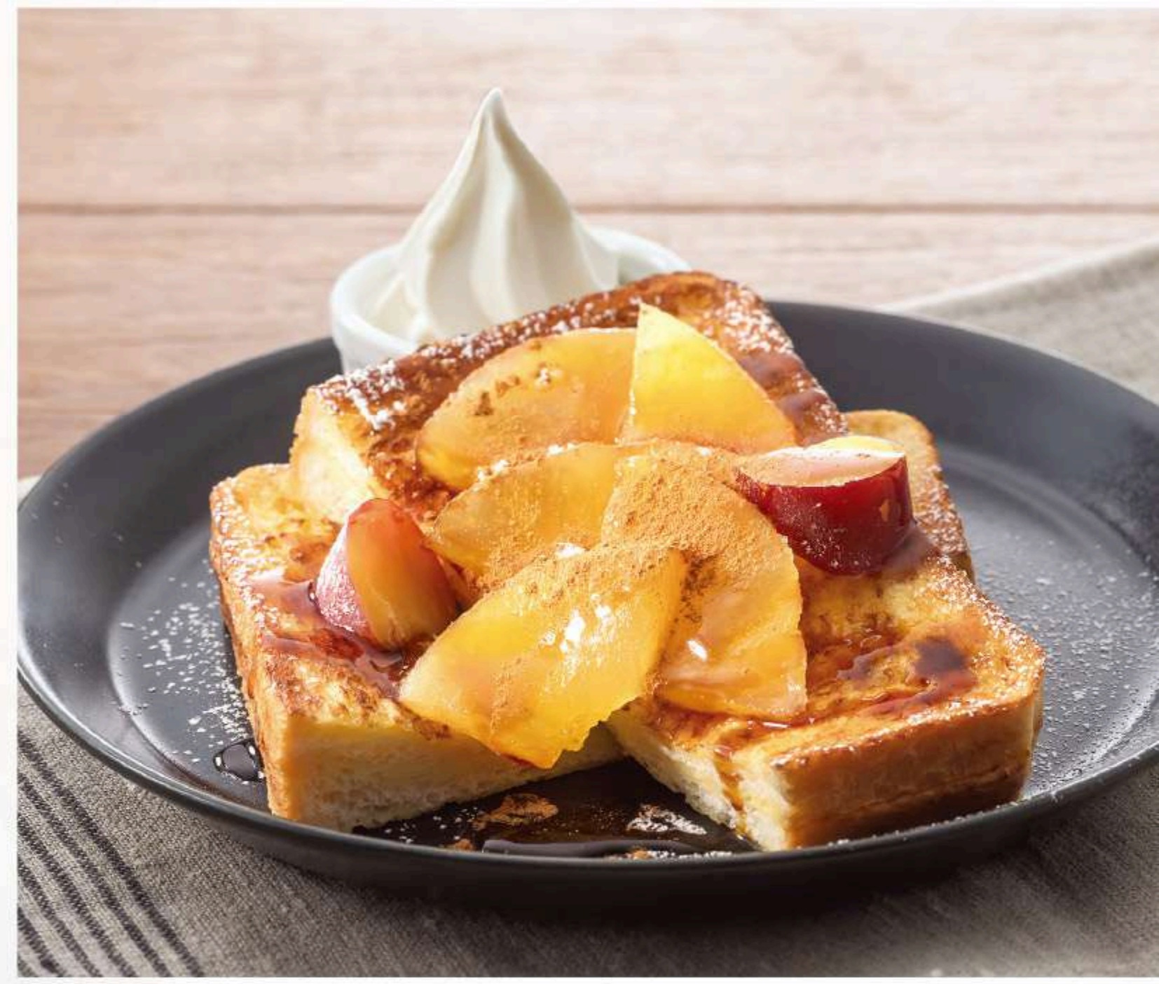
シナモンアップルフレンチトースト 880円