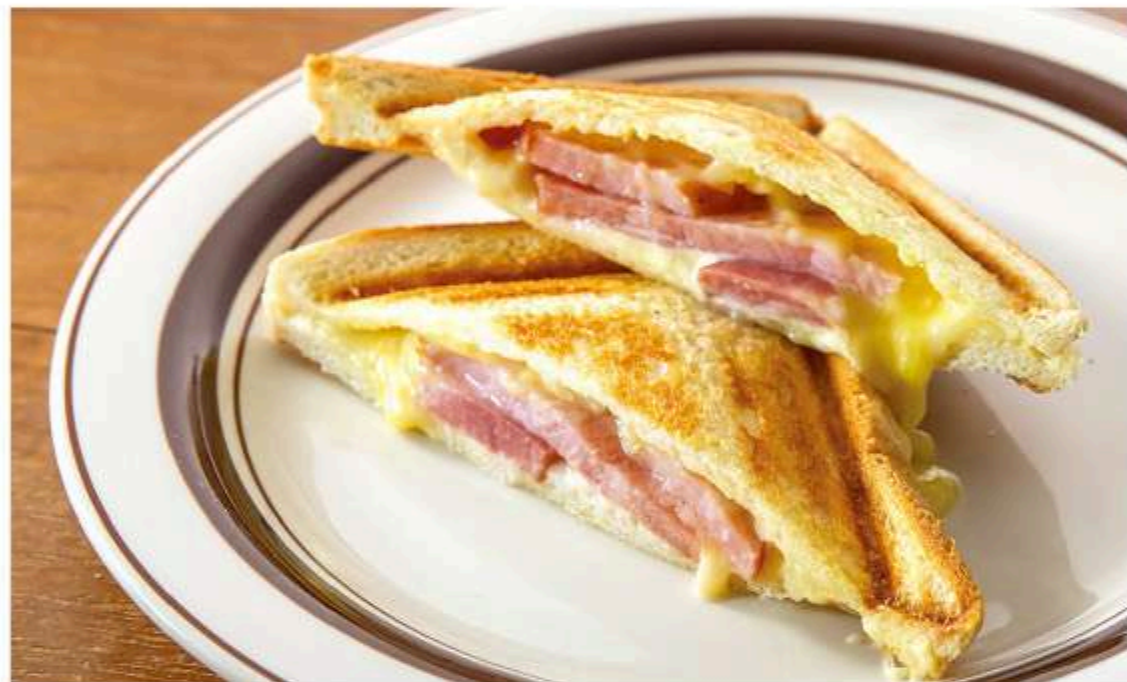
ベーコンチーズのホットサンド 690円