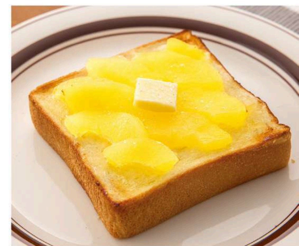
林檎塩バタートースト 640円