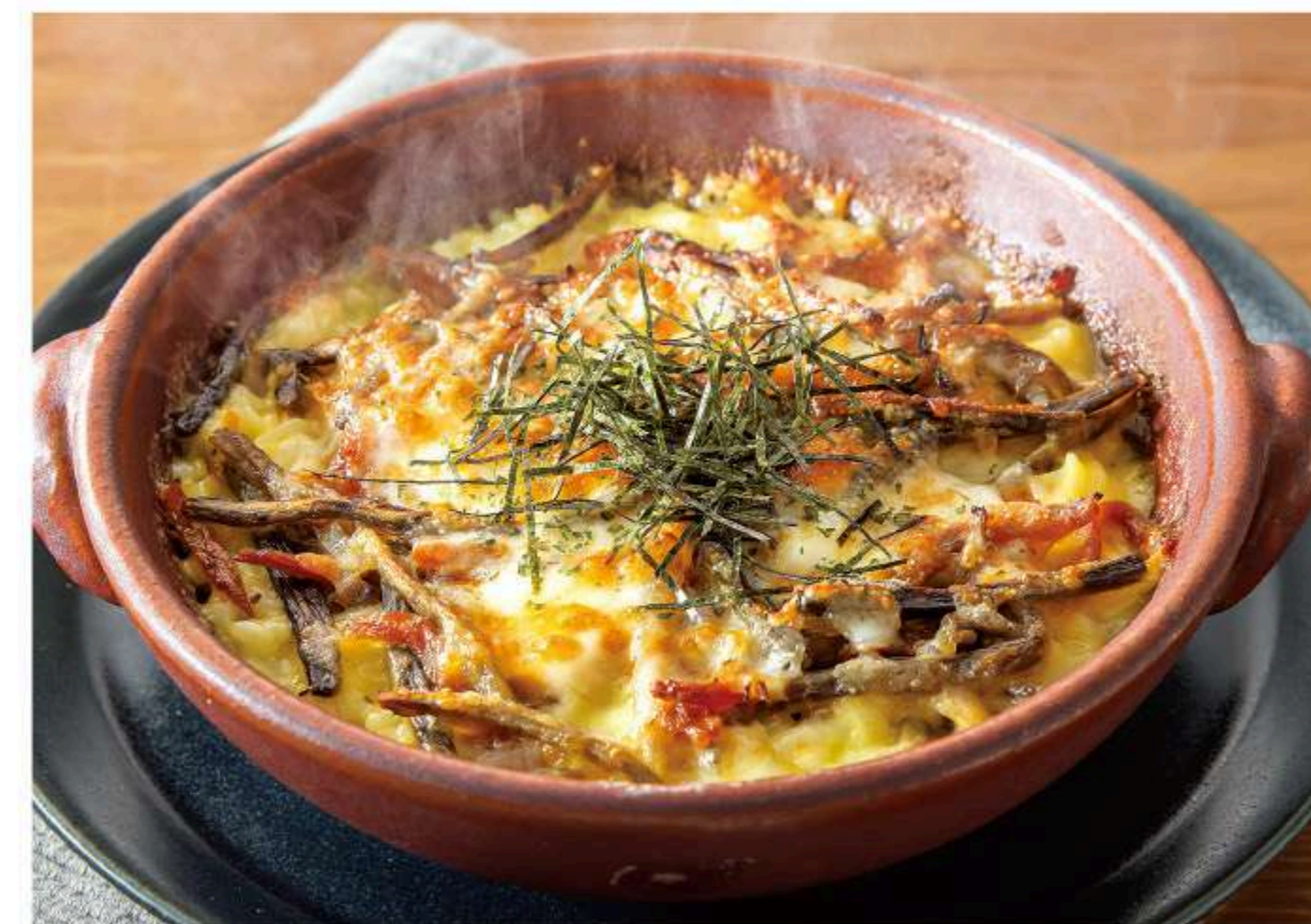
塩麴チキンときんぴらの 和風クリームドリア 980円