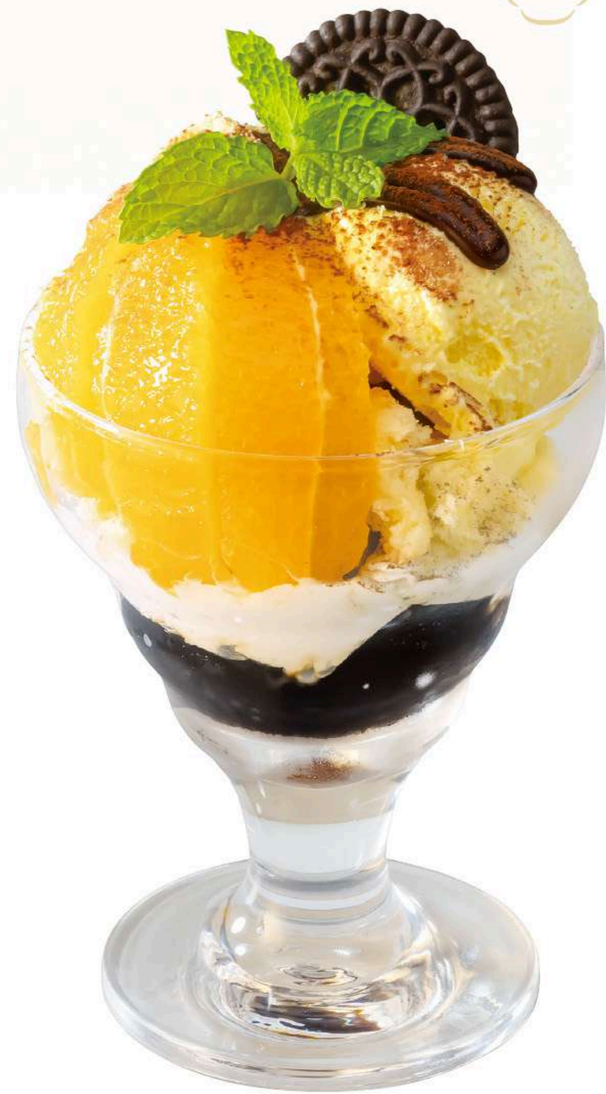
ティラミスパフェ 750円