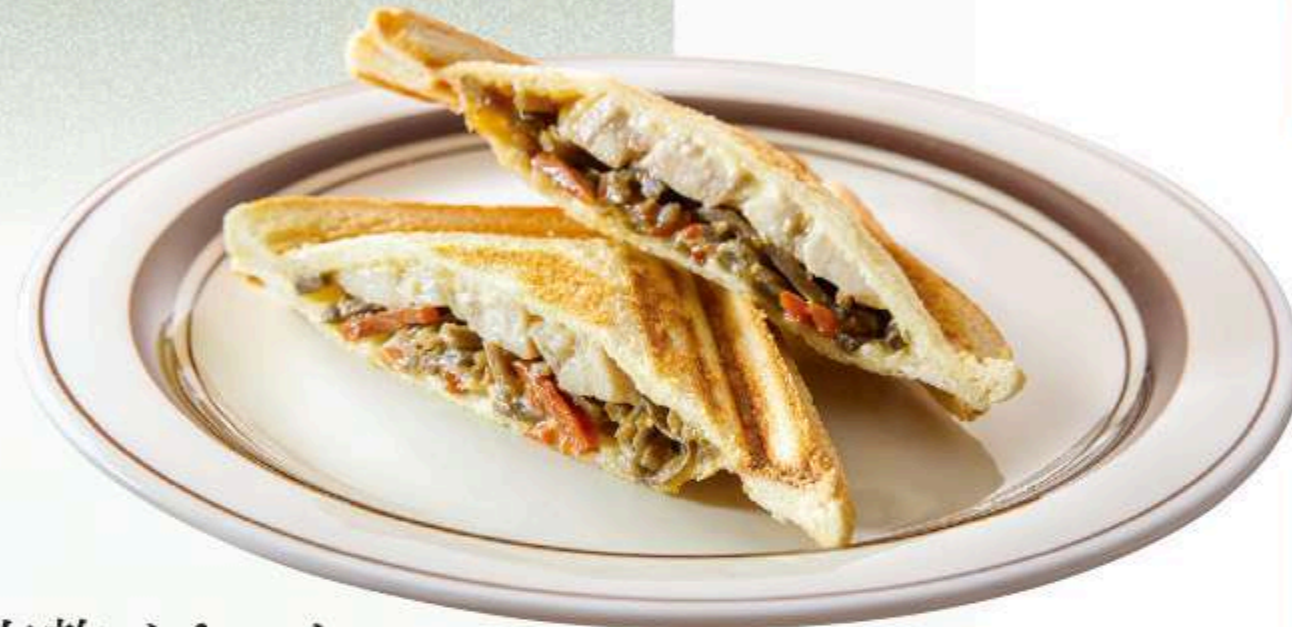
塩麴チキンと きんぴらのホットサンド 750円