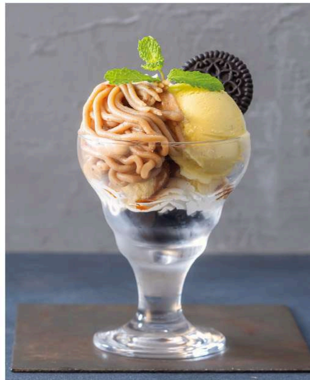
モンブラン パフェ 750円