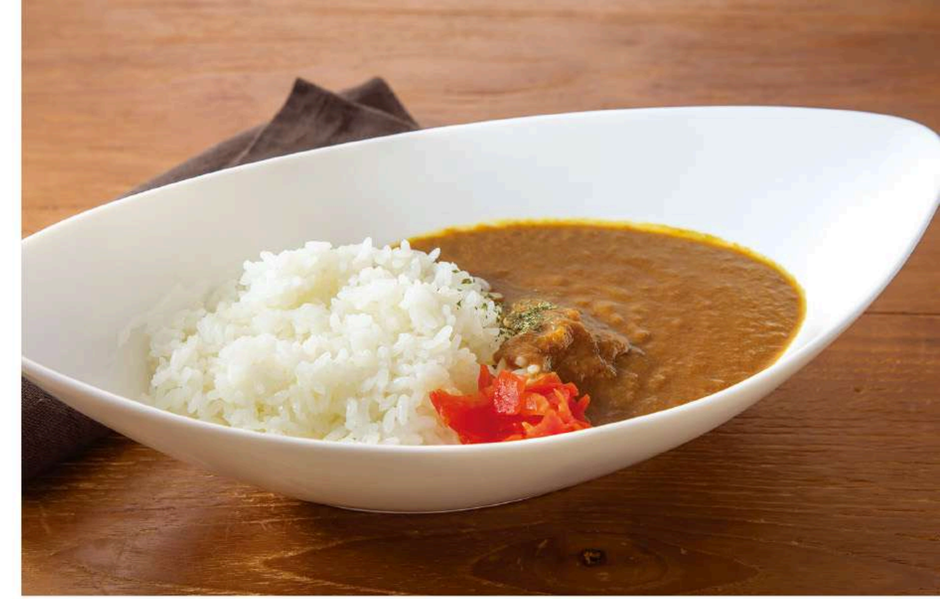
倉式欧風カレー 870円