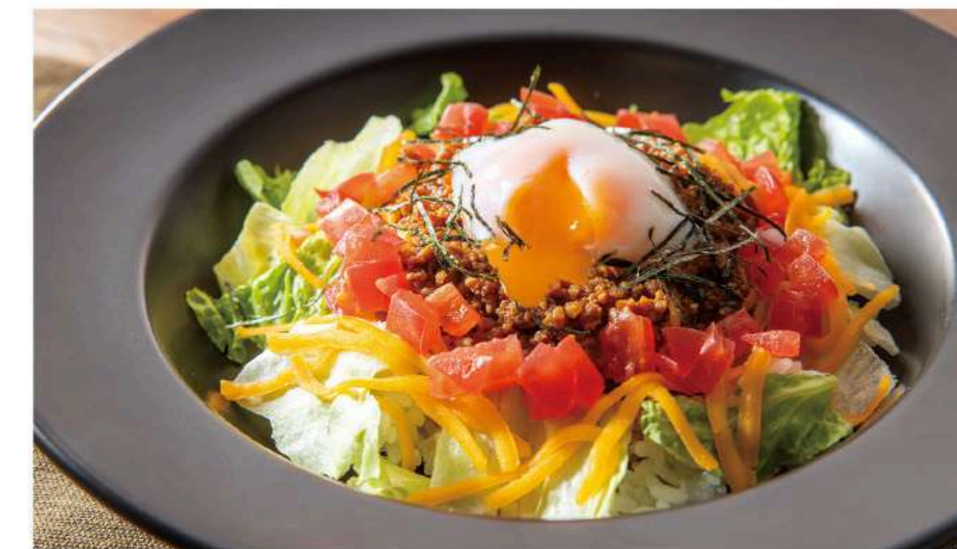
和風タコライス 960円