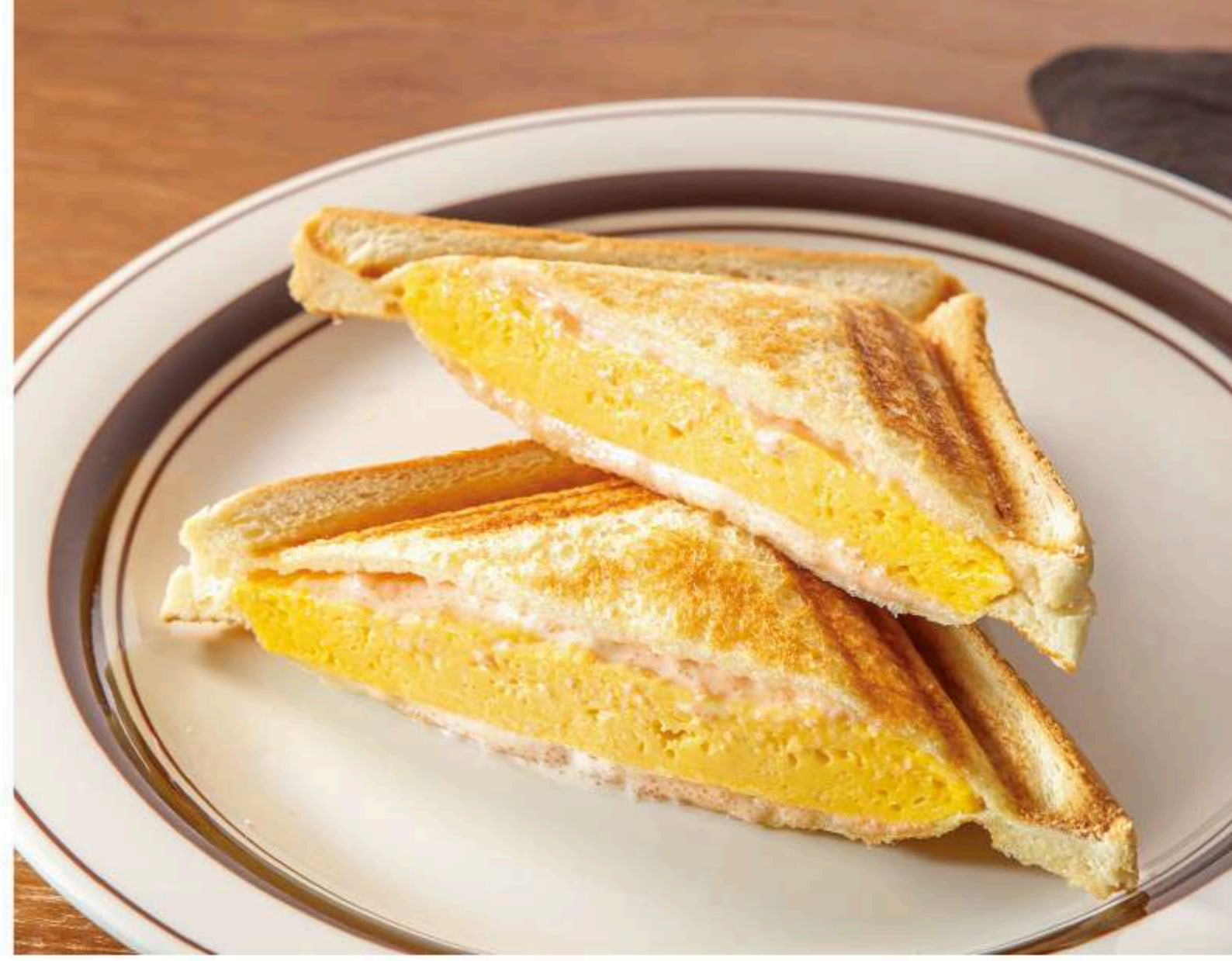
明太マヨと厚焼き玉子のホットサンド 750円 ふわふわジューシーな厚焼き玉子をサンドしました。