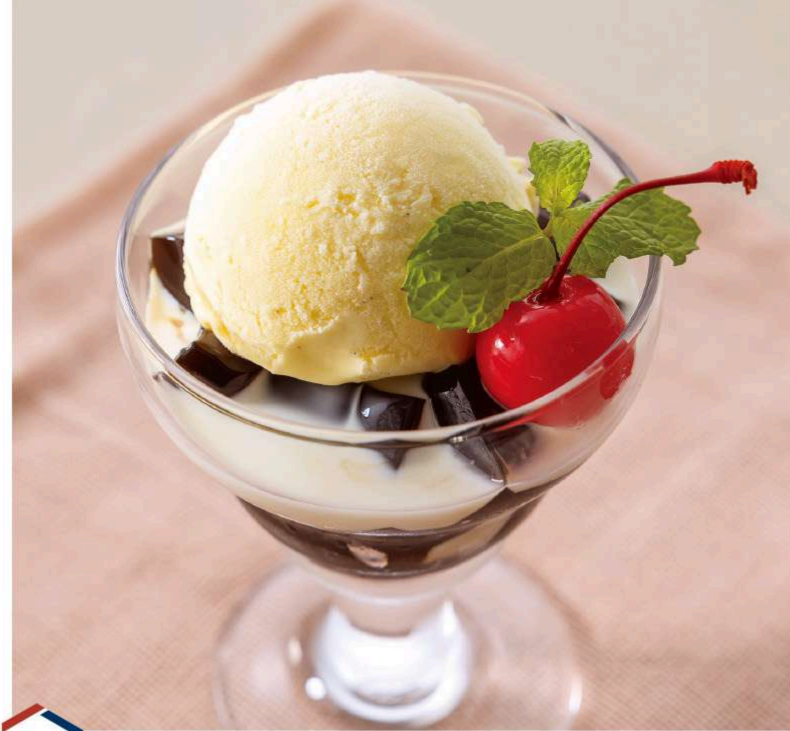
人気! 倉式珈琲ゼリー 630円 当店自慢の珈琲を使った自家製珈琲ゼリーです。