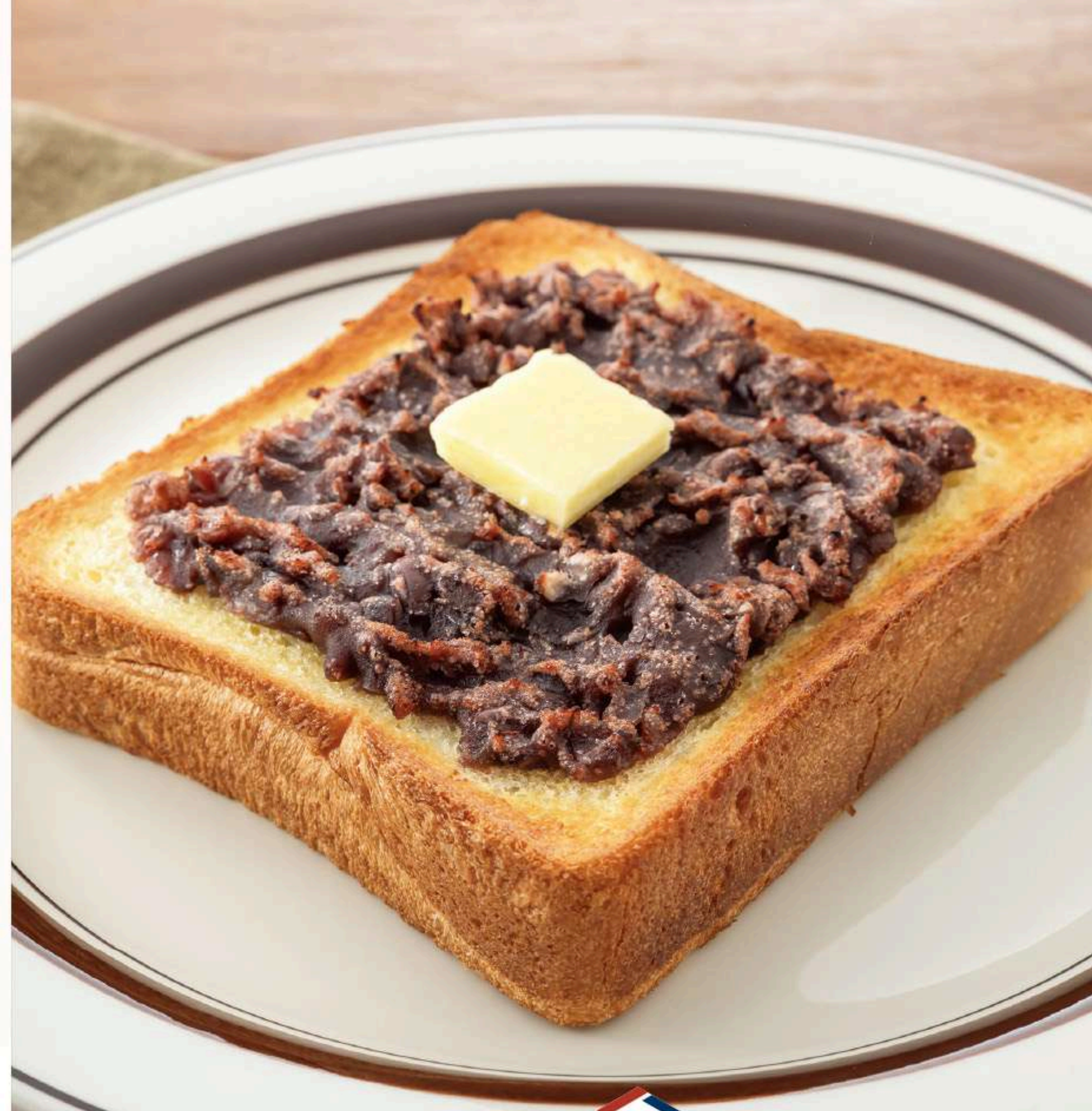
定番 あんバタートースト 590円

たっぷりのつけたつぶあんの甘さと バターの塩気が相性抜群。 甘辛デザートの本命。